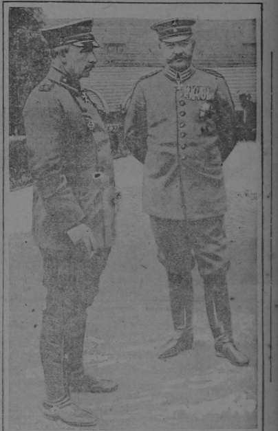
THE KAISER AND VON HINDENBURG. (PHOTOGRAPHED BY THE KAISERIN)

Los dos héroes más populares en Alemania: el Kaiser y el Mariscal von Hindenburg se ven en una fotografía en que aparecen juntos y que está de gran moda en Alemania. Esta fotografía despierta tanto más interés cuanto que fue tomada por la misma Emperatriz en una reciente visita que hizo al frente oriental a donde el Kaiser había ido a celebrar una conferencia con el General cuyos ejércitos han derrotado a las tropas del Zar.