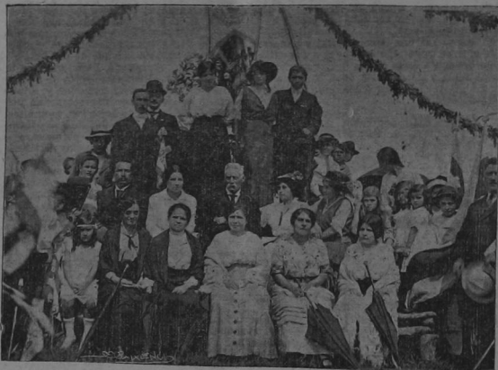
Grupo de profesores y profesoras de la Escuela "Juan Rafael Mora" y de la de San Francisco que organizaron la fiesta escolar

Escolares, maestros y público desfilaron después al campo escogido para el Match de fútbol jugado entre el deporte del CLUB LA LIBERTAD Y SOCIEDAD GIMNASTICA ESPANOLA. Fue el día de ayer un match de lo más reñido e interesante por el antagonismo de supremacía en esa clase de juegos deportivos que existen entre esos dos importantes colegios. Pocas veces hemos visto tan ocurrido un match como ayer, ni los que se celebran en días de fiestas cívicas. Los jugadores totales portaron se a la altura de su deber; lucharon como buenos; todos ellos defendieron sus puestos de manera valerosa y hasta heroica muy pocas veces el público entusiasmo maduro, delirio indescriptible entre los fanáticos del fútbol. Ganó el team de La Libertad a estos señores el público lo oprobación muy merecidamente. Hay que deplorar un delicado accidente: en uno de los encajes, al chocar pierna con pierna, valerosa y hasta heroica muy pocas veces el público entusiasmo maduro, delirio indescriptible entre los fanáticos del fútbol. Ganó el team de La Libertad a estos señores el público lo oprobación muy merecidamente. Hay que deplorar un delicado accidente: en uno de los encajes, al chocar pierna con pierna,